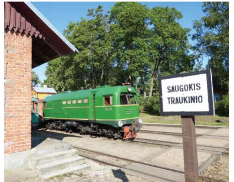
Kroviniai per Anykščių geležinkelio stotį keliavo 100 metų.

VŠĮ „Aukštaitijos siaurasis geležinkelis“ dirba apie 20 žmonių.