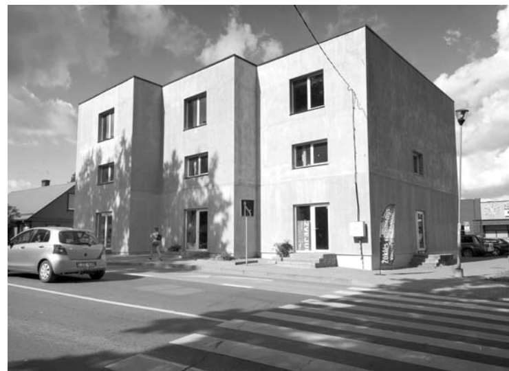
Prasidėjus karantinui atidėti planai baigti buvusios pieninės pastato rekonstrukciją.