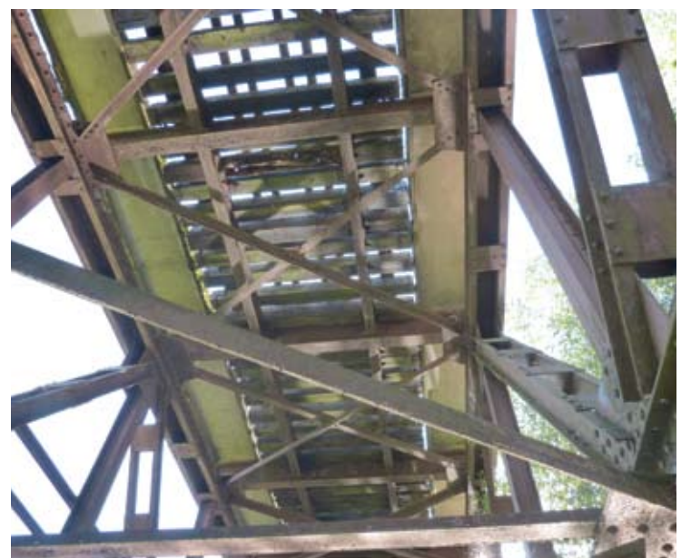
Siaurojo geležinkelio tiltas per Šventąją Anykščiuose gąsdina anykštėnus.

Jau dvidešimt metų „Siaurukas“ naudojamas pramogoms - juo turistai važiuoja užsako-maisiais reisais. O šiltoju metų laiku, savaitgaliais, traukinukas turi ir maršrutinius reišus Anykščiai-Rubikiai-Anykščiai. Eksploatuojamas 68 kilometrų ruožas Panevėžys- Anykščiai- Rubikiai. Mūsiškis siaurojo geležinkelio ruožas ilgiausias eksploatuojamas