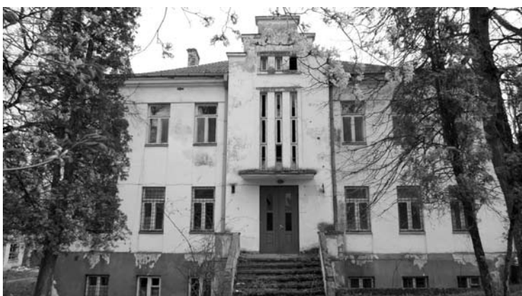
Buvusios Kavarsko ligoninės pastatas stovi nykus ir apleistas...

Darbas atsakingas, su gyvybe, ir net su dviem gyvybėm. Atskiros būdavo moterų gimdyvių ir naujagimių palatos. Pagal valandas nešdavom naujagimius motinoms, kad pamaitintų, ir vėl išnešam. Tris dienas neleidavom gimdyvei atsikelti iš lovos. Aštuntą parą išleidavom namo. Jei bambutė kūdikėliui nenukrenta, tai ir ilgiau palaikydavom ligoninėje. Mišinių nebūdavo, tai jei viena gimdyvė pieno neturėdavo, kita turėdavo – pamaitindavo ir savo, ir kitos. Na, jei naktį kūdikėlis būdavo labai neramus, nunešdavom prie motinos, bet tokios taisyklės buvo, kad atskiroje patalpoje motinos, atskiroje – naujagimiai. Kas tris valandas nešam, kad pamaitintų, ir atgal. 100 lovų Gimdymo skyriuje stovėjo. Jokių lankymų nebūdavo, tik pro langą parodydavom naujagimį. Jei dirbčiau dabar ir vyrai gimdymuose dalyvautų, man netiktų. Juk dirbi, susikaupi, o dar čia tas vyras maskatuoja... Turėjom vieną šildomą lovele, deguonies balionus. Jei gydytojas matydavo, kad gresia priešlaikinis, siųsdavo Panevėžin ar Ukmergėn – į didelę ligoninę, kur daugiau tos pagalbos teikiama. Po visą parą iš pradžių dirbdavom, vėliau – po 12 valandų. Būdavo įtampos, nervų. Dėkui dievui, gimdyvės visos išgyveno. Vaikų gimdavo ir sveikų, ir apsigimusių, ne gyvenimui... Apskritai mediko darbas yra labai atsakingas. Kavarske dar Vidaus skyrius buvo ir Chirurgijos. Dirbau medicinoje iki 1991 metų. Jau pensijoj buvau, bet dar šiek tiek dirbau ir pensininke būdama“, – kalbėjo 90-ties močiutė.