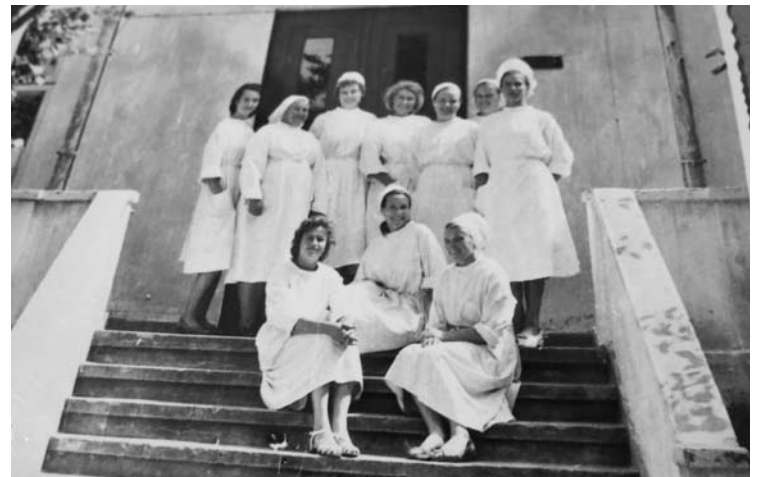
Kavarsko ligoninė 1962 metais.

Pasak pašnekovės, padėjėja blynų pakepdavo, keliuką iki malkų atkasdavo, kai užsnigdavo. „Greit ta valanda praeidavo, ypač žiemą, kai daugiau darbo. Vasaromis lengviau. Sūnus iš Kauno atvažiudavo, aplankydavo ir anūkai. Marti ką nors pasodindavo. Aš pati jau iš kiemo nebeįsėinu... Vyro nebeturiu, kaimynų, mano draugių taip pat nemažai jau išėjusiųjų iš šio pasaulio, tušti namai liko mūsų gatvėje. Kai kurias močiutes vaikai žiemai išsiveža pas save“, – kalbėjo senolė.