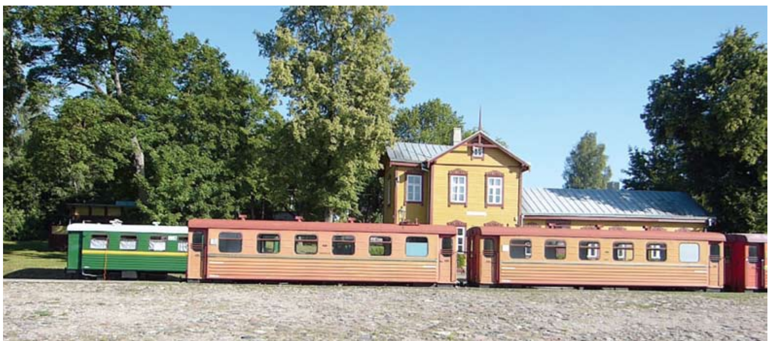
Šiltoju metų laiku maršrutiniai traukinukai važiuoja nuo Anykščių iki Rubikių ir atgal. Beje, yra ir visai trumpas maršrutas - nuo stoties iki Anykščių menų inkubatoriaus.