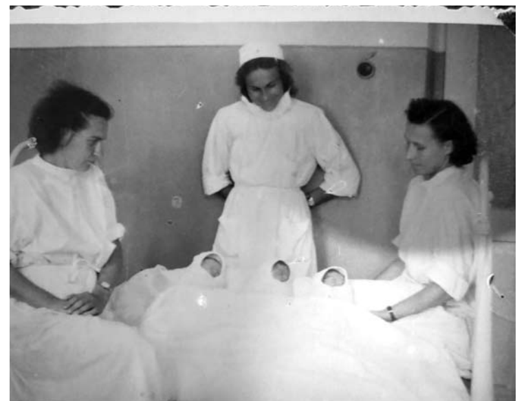
Retas įvykis - Kavarske gimė trynukai.